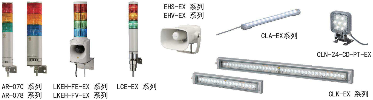
AR-070 系列 LKEH-FE-EX 系列 LCE-EX 系列 AR-078 系列 LKEH-FV-EX 系列

我們為您提供全方位的防爆產品供您選擇。下列所有產品規格符合ATEX標準（CENELEC標準），可使用在危險場所2區和22區。